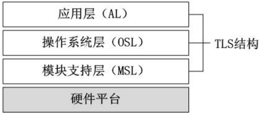
图 3-1 宇航嵌入式设备软件架构