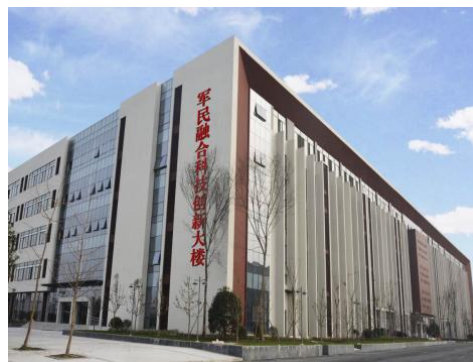
军民融合科技创新大楼