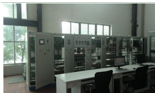
分布式发电与微电网平台