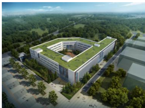
军民融合研究院鸟瞰图

研究院以导师工作组的模式指导研究生，导师工作组由军方、军工企业、科研院所等知名专家教授组成。研究院注重军民两用技术方面的人才培养，为就读研究生提供参与军民融合课题研究和赴军工企业实习的机会。此外，学校与西南财经大学联合培养军民融合国防经济学博士研究生，为硕士研究生的进一步深造创造条件。