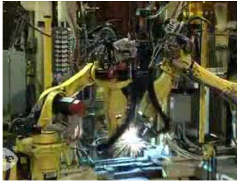
机械工程学院研发的焊接机器人